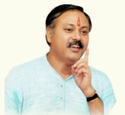
स्वर्गीय राजीव दीक्षित जी

पूरे भारत में हमारे 80+ क्लिनिक व 40+ से अधिक हॉस्पिटल व डे केयर सेंटर हैं