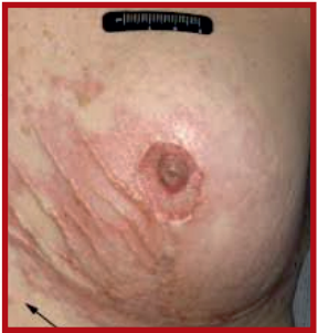
28.2% of all female cancers in 2022 Breast cancer is the most common cancer in India

कैंसर होने के शुरुआती लक्षण:- हृदय रोगों के बाद कैंसर को सबसे ज्यादा मौत होने के लिए ज़िम्मेदार दूसरी बीमारी माना जाता है। कैंसर एक जानलेवा बीमारी है जिसका नाम सुनते ही मन कांप उठता है। पर अगर समय रहते कैंसर के लक्षण पहचान कर सही ईलाज किया जाए तो इस घातक बीमारी से निजात पाई जा सकती है। इस बीमारी में थोड़ी सी लापरवाही और देरी घातक साबित हो सकती है। जैसे:- सांस चढ़ जाना, स्त्रियों के स्तन, पुरुषों के टेस्टिकल्स या शरीर के किसी और हिस्से में गाँठ हो जाना, कुछ भी निगलने और हजम होने में मुश्किलें, शौच में बदलाव महसूस होना। अगर ये बार - बार लम्बे समय तक होता जाए तो ये "Colon Cancer" का लक्षण हो सकता है। Period में ज्यादा समय तक "Bleeding" होना, दर्द, ब्लड क्लॉट्स, वज़न घटना और थकान, लिम्फ नोड्स में सूजन, न्यूरोलॉजिक और मस्कुलर लक्षण, श्वसन लक्षण आदि।